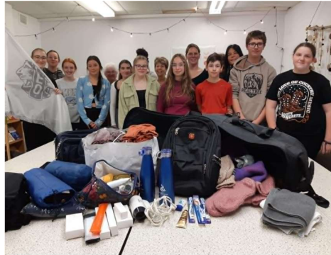
Dons aux travailleurs de rue

Cette soirée sert à sensibiliser les gens du milieu à la réalité des itinérants.